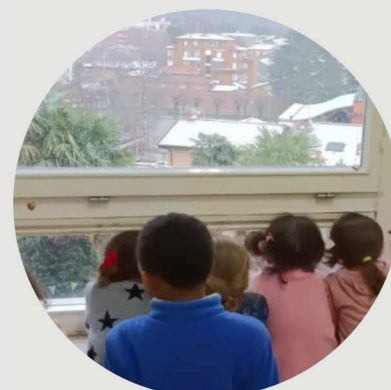
I bambini incantati dai fiocchi di neve

I bambini che dovessero fermarsi oltre le 15.45 verranno aggregati al gruppo del doposcuola.