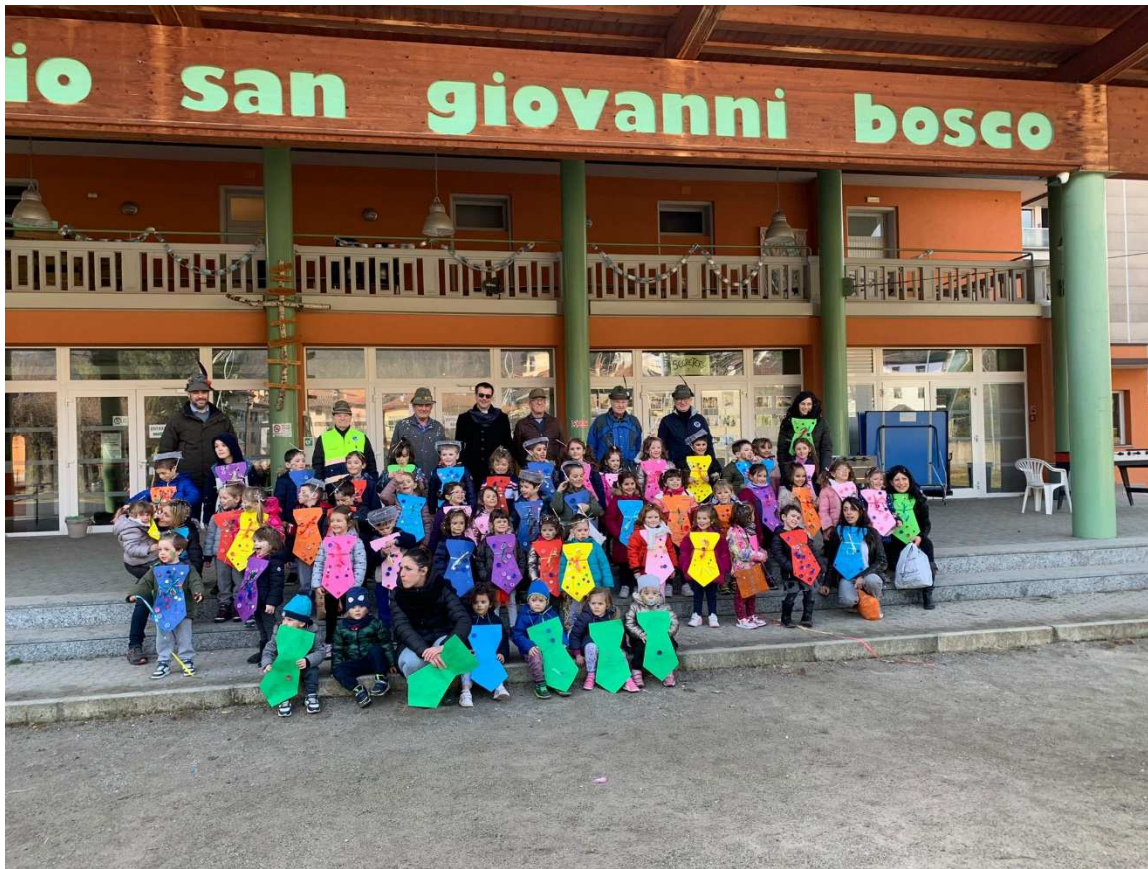
Carnevale 2023 – Venerdì 17 Febbraio 2023 – Con gli alpini e Don Giovanni in oratorio con i costumi del riciclo e della sostenibilità.